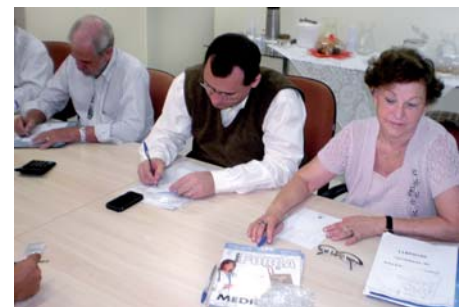
17/11 - Negociação com o Sinditec