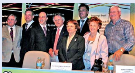
Presidente Janete durante o evento

A Frente Parlamentar Mista para o Desenvolvimento da Indústria Têxtil e de Confecção realizou a terceira reunião itinerante dia 12 de setembro, em São Paulo. O evento reuniu parlamentares, empresários e sindicalistas do setor.