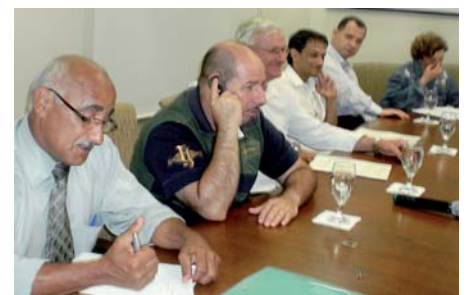
19/10 - Negociação com o Sinditêxtil